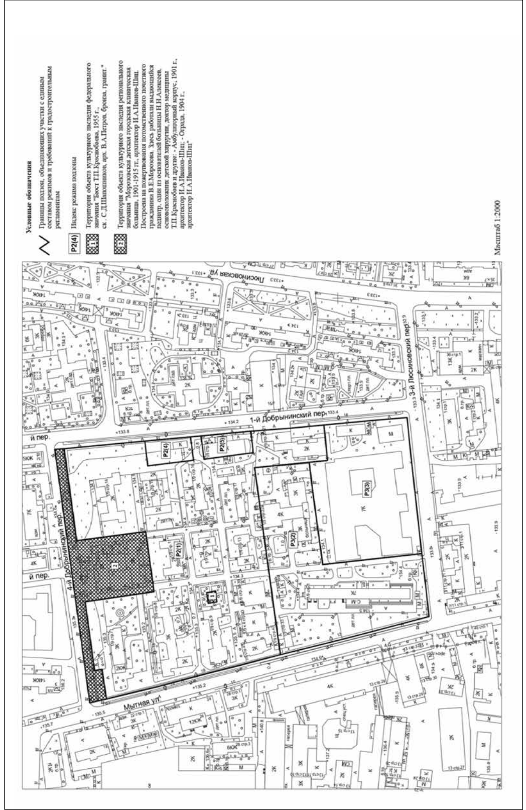
Схема режимов использования земель на территориях зон охраны объектов культурного наследия в границах квартала № 1275 Центрального административного округа города Москвы

Приложение 1 к постановлению Правительства Москвы от 31 июля 2018 г. № 849-ПП